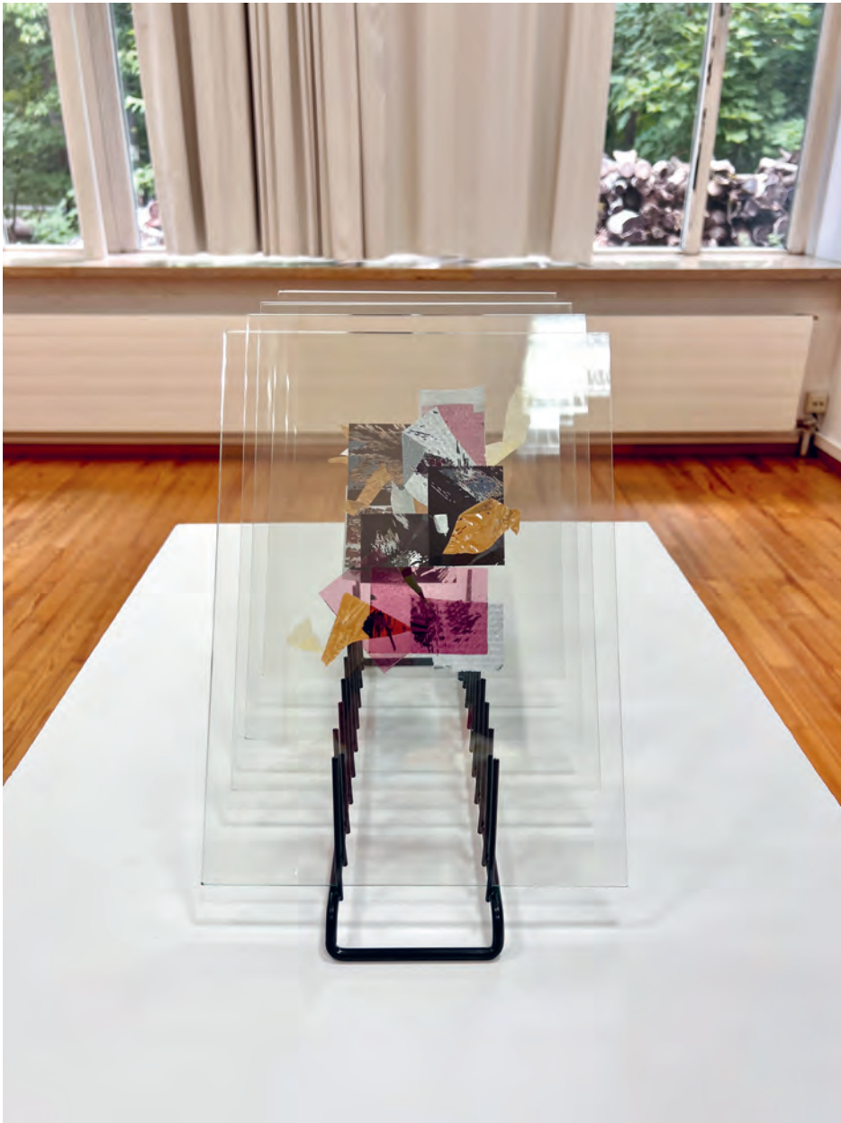
Polaroid Fragmente, 2022 sezierte Polaroidfotografie Polaroidfotografien, Glas, Tellerhalter 28×21×40cm