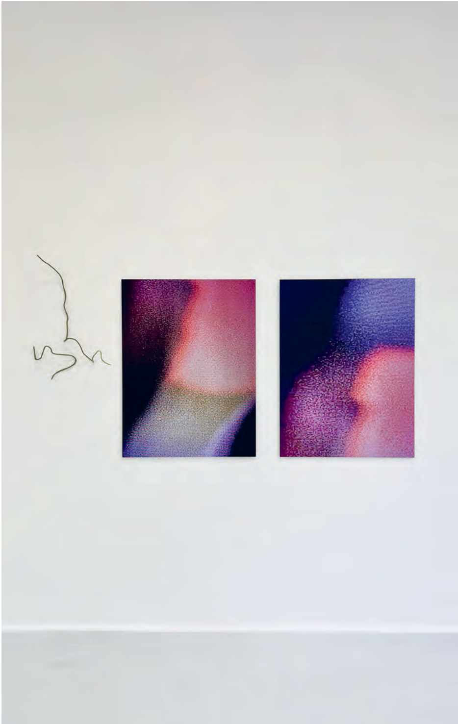
fading pink I | II, 2021 Fotomalerei Alu-Dibond je 120×90 cm