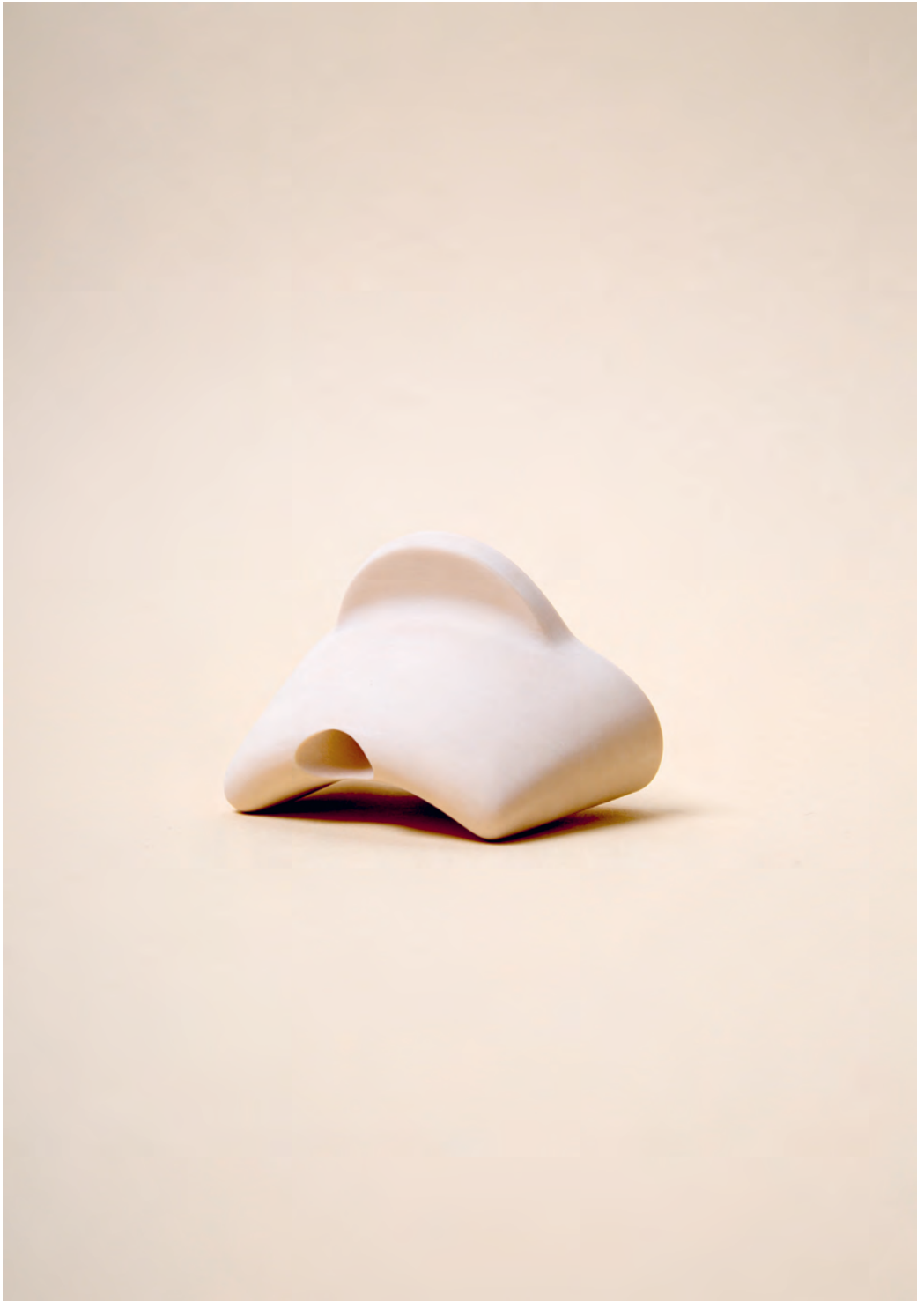
nude, 2017 Objekt/Anhänger Kunststoff 8×6,5×5,5cm