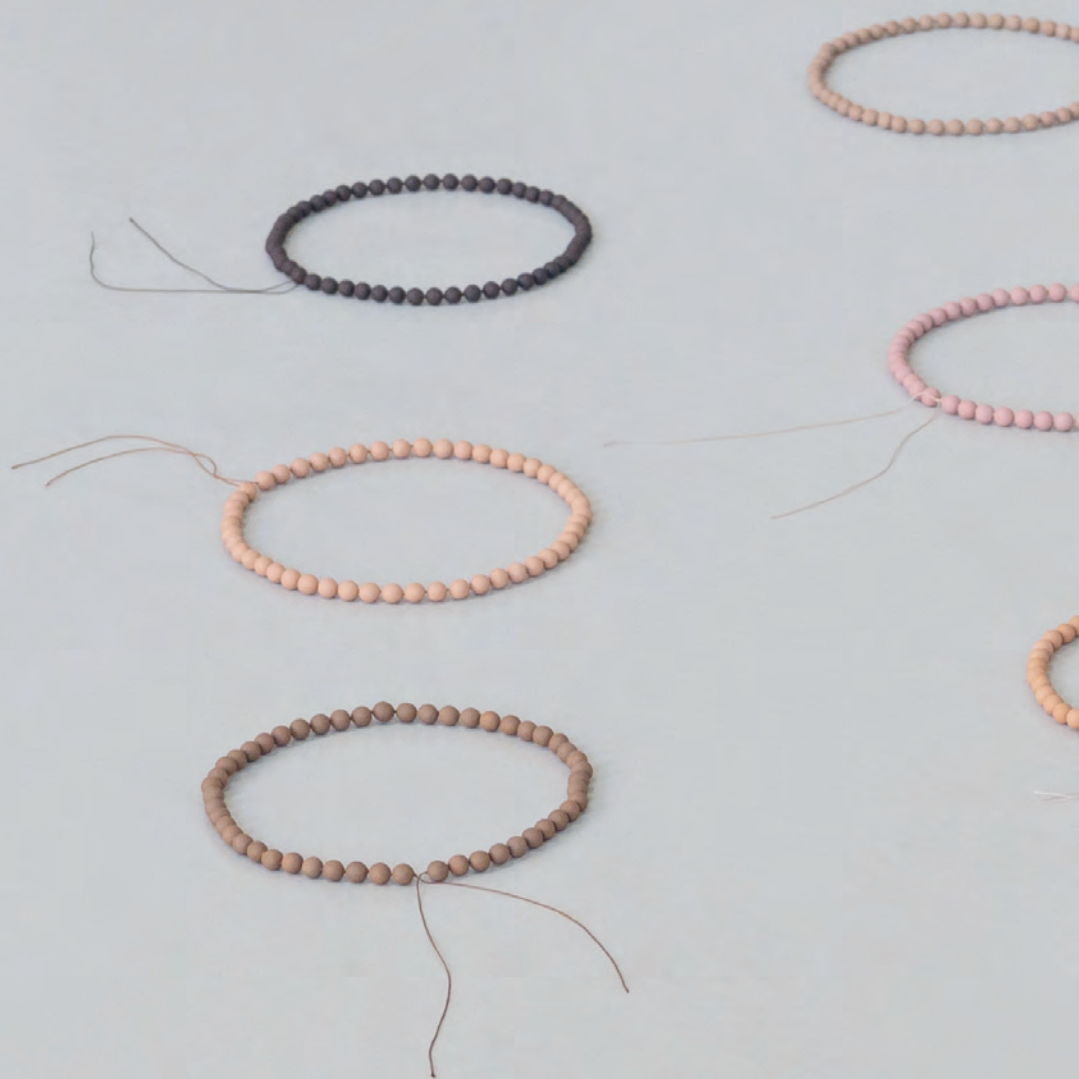
Perlen, 2022 Perlenketten geknüpft Ton, Seide ca. 15×15 cm