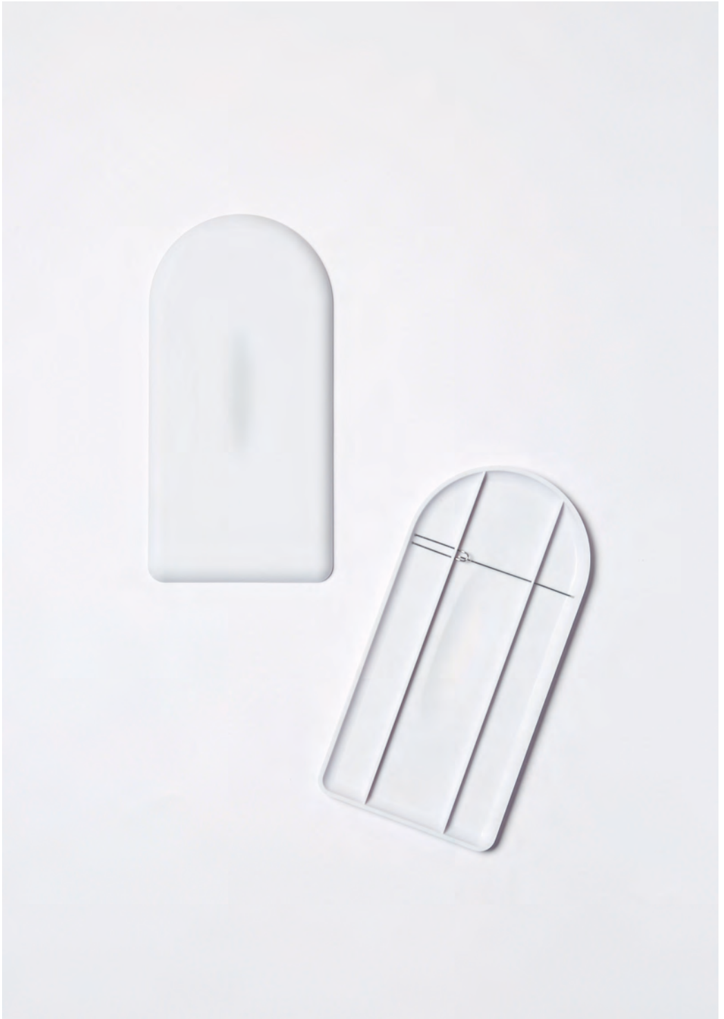
tools, 2016 Broschen Kunststoff, Edelstahl 7,5×7,8×3,2cm