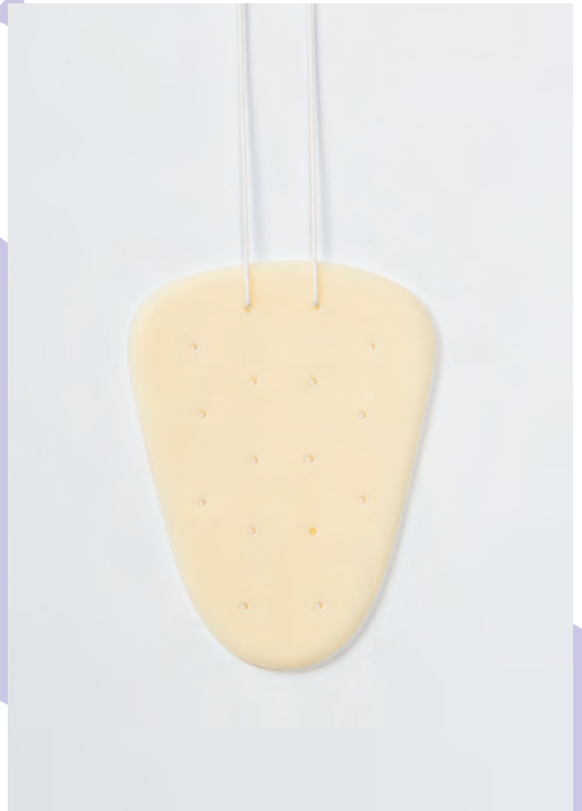
Schild, 2018 Anhänger Kunststoff, Baumwolle 12×9cm