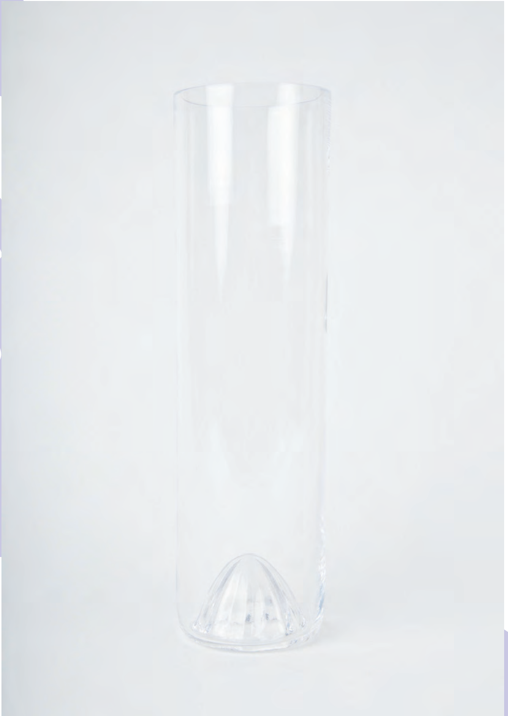
Presse, 2021 Objekt, Naturschwamm 12×12×8 cm