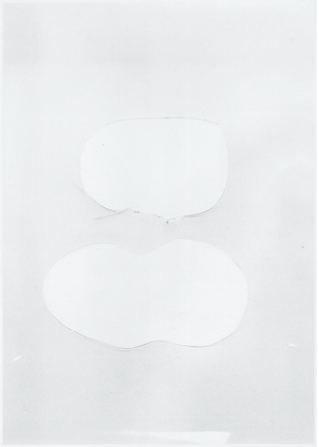
Absence, 2016 Kopie auf Papier 21×29,7cm