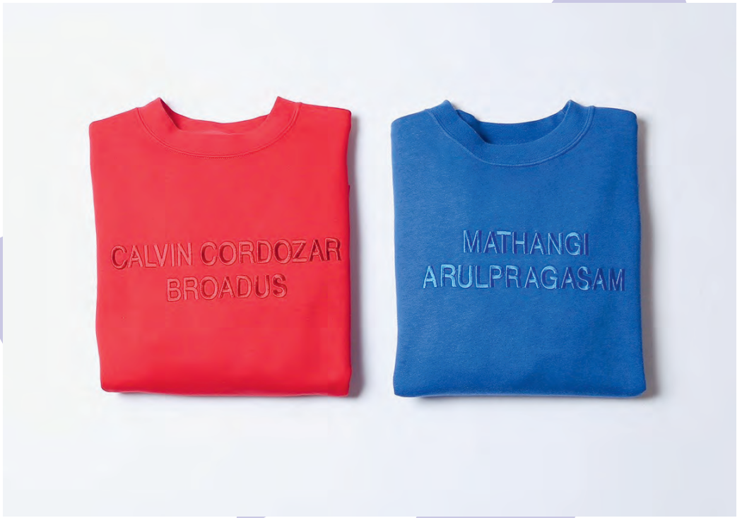
silent fan, 2016 Pullover monochrom bestickt in Kooperation mit Jonas Dorner