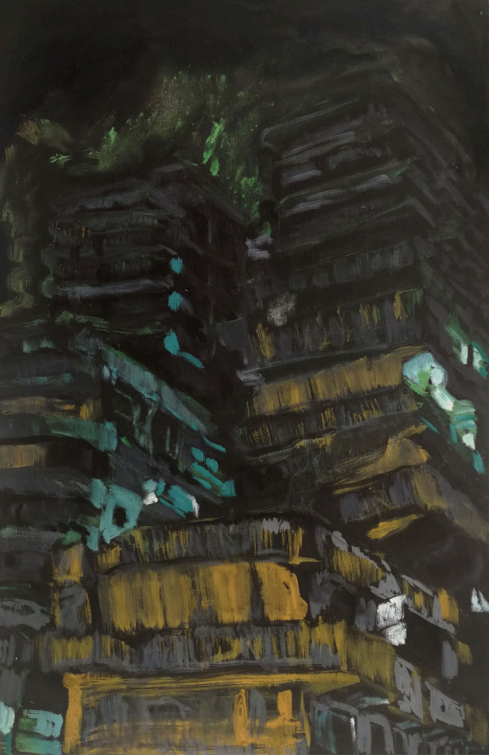
Simon Tobias Pröbstl